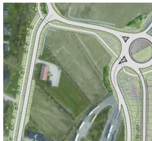
Figur 8. Utdrag ur gestaltungsprogram, upprättat av Ramböll Sverige AB & Trafikverket. Föreslagen gång-och cykelväg längs del av Ängebyvägen samt anslutning till cirkulationsplats.