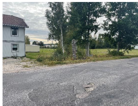
Figur 11. Del av befintlig byggnad inom Röde 1:50 samt ett av diken som skär genom fastigheten i östlig riktning.

Natur- och terrängförhållandena blir opåverkade av aktuellt upphävande. Ett planlöst läge innebär ingen förändring av befintlig markanvändning i praktiken. Däremot kommer ovanbeskrivna förhållanden påverkas av de åtgärder som föreslås av vägplanen vid genomförande, för detta ansvarar Trafikverket.