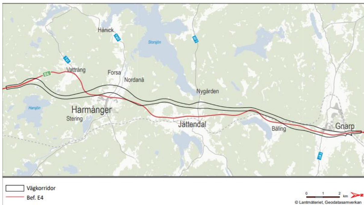
Figur 6. Kartbild från Trafikverkets vägplan över befintlig E4 genom kommunen och den vägkorridor inom vilken nya E4 nu planeras.

Arbetet med vägplanen drivs av Trafikverket och sker fortlöpande. Den nya vägsträckningen påverkar flera intressen och utformningen av den tilltänkta sträckningen styrs av väglagen (1971:948) och miljöbalken (1998:808). Planen är att bygga om vägen i ny sträckning via västra Harmånger, så att Harmånger–Gnarp går förbi Jättendal–Bäling–Gnarp. Om vägen skulle byggas om i befintligt läge skulle det medföra stora intrång på omkringliggande fastigheter. Nedan finns en redovisning av vägsträckans befintliga läge och den vägkorridor inom vilken den nya vägsträckan genom kommunen föreslås. En fastställelse av vägplanen är beräknad till sommaren 2023.