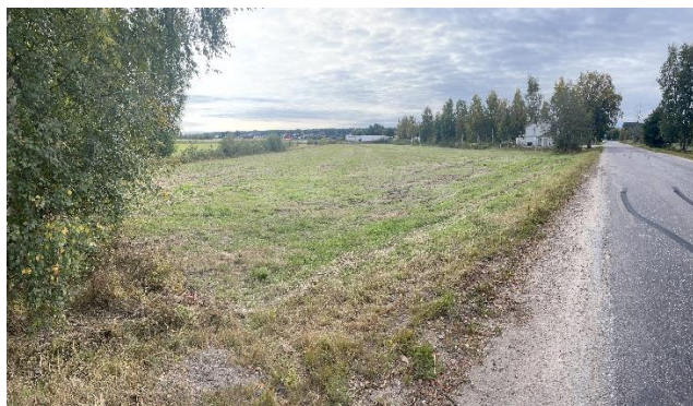
Figur 10. Ängebyvägens sträckning söderut med åker/betesmark i planområdets nordöstra del.

Söder och norr om befintlig byggnad inom fastigheten Röde 1:50 finns grävda diken som skär genom fastigheten i riktning österut. Dessa kantas av träd och sly. I planområdets nordvästra samt nordöstra del omfattar upphävandet områden som till viss del består av åker- och betesmark.