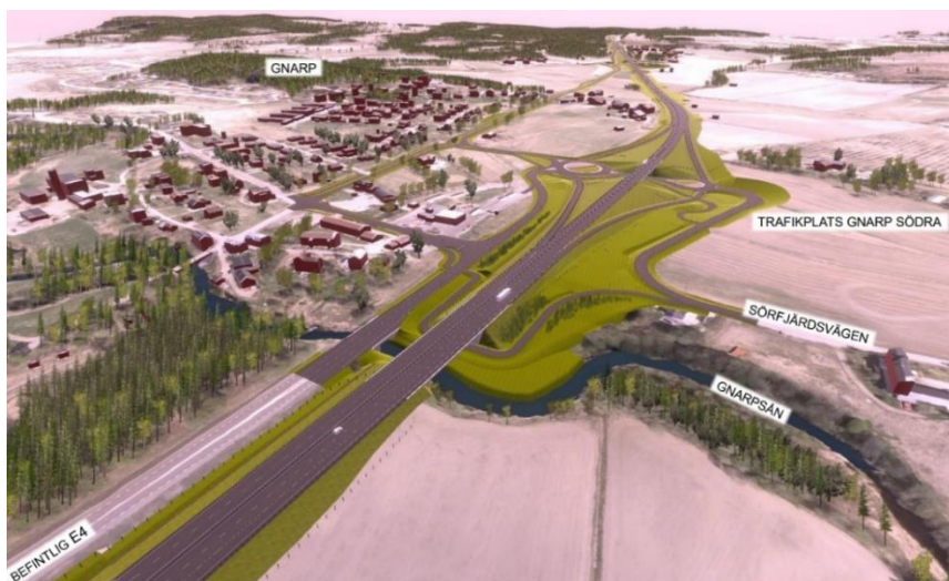
Figur 2. Illustration av trafikplats Gnarp Södra.