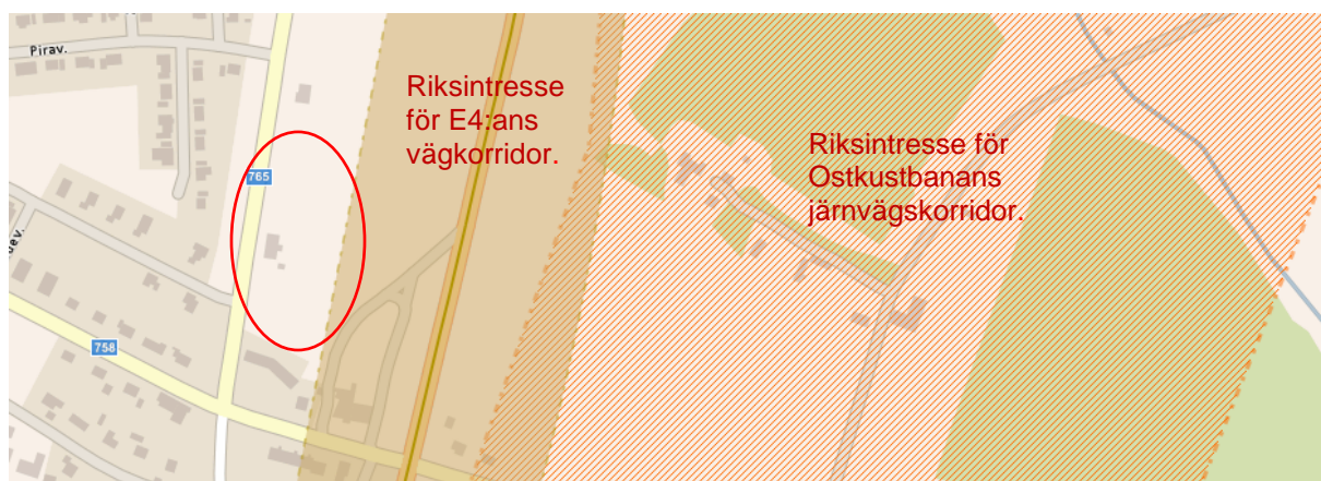
Figur 9. Utdrag från Trafikverkets karttjänst för riksintressen. Detaljplaneområde inringat.

Gällande detaljplaneområde omfattas österut av riksintresse för kommunikationer (beslutade vägkorridoren för ny E4) Området för aktuellt upphävandet angränsar dock endast till riksintresset. Längre österut finns ytterligare ett riksintresse för kommunikationer, Ostkustbanans framtida järnvägskorridor.