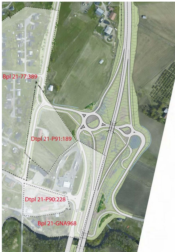
Figur 5. Utdrag ur Trafikverkets gestaltningsprogram med rendering av kommunen för redovisning av berörda detaljplaner/byggnadsplaner.

I illustrationen nedan visas de detaljplaner och byggnadsplaner inom vilka delområden nu föreslås upphävas.