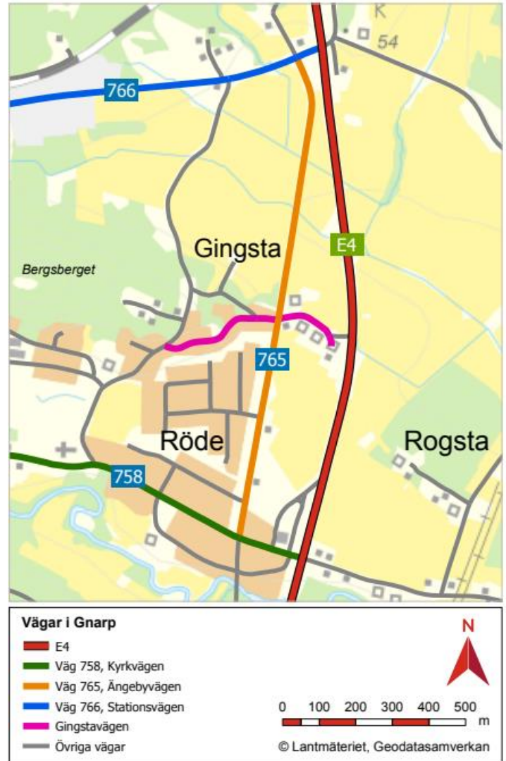
Figur7. Kartbild från Trafikverkets vägplan över vägar i Gnarp som ingår i vägplanen och som kommer att påverkas vid genomförandet av denna.

I Trafikverkets projektet påverkas Ängebyvägen från korsningen med Kyrkvägen i söder till korsningen med Stationsvägen i norr.