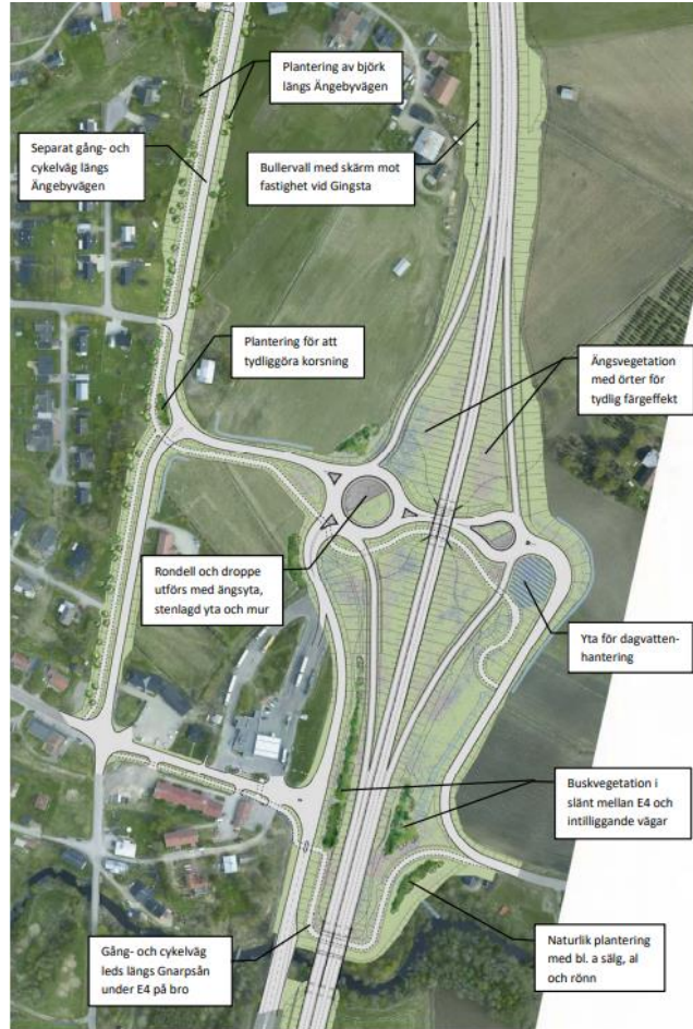
Figur 1. Utdrag ur gestaltungsprogram, upprättat av Ramböll Sverige AB & Trafikverket, tillhörande vägplanen. Illustrationen visar trafikplats

Trafikverket arbetar med att planlägga E4:ans nya sträckning genom Nordanstigs kommun. En del av detta arbete är att upprätta en vägplan för den tilltänkta vägsträckan. För att Trafikverket ska kunna genomföra vägplanen krävs det att vägplanen inte strider mot gällande detaljplaner. För aktuellt område är den planerade vägsträckan i strid med den markanvändning som gällande plan medger, varför ett upphävande nu föreslås ske. Upphävandet syftar således till att möjliggöra fastställelse av Trafikverkets vägplan, som i sin tur är en viktig del i det fortsatta arbetet för att realisera E4:ans nya sträckning genom Gnarp.