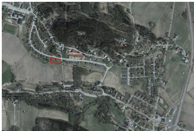
Planområdet för den detaljplan som föreslås ändras ligger längst med Södra vägen, söder om Berggården.

Förslaget innebär att platsen tillåts användas för bostads samt kontorsändamål. Den nya detaljplanen tillåter även byggnader i två våningar samt att den totala byggnadshöjden tillåts uppgå till totalt 8 meter istället för tidigare 4,5 meter. Den totala byggnadsarean av 1200m 2 lämnas oförändrad likt den nu gällande planen.