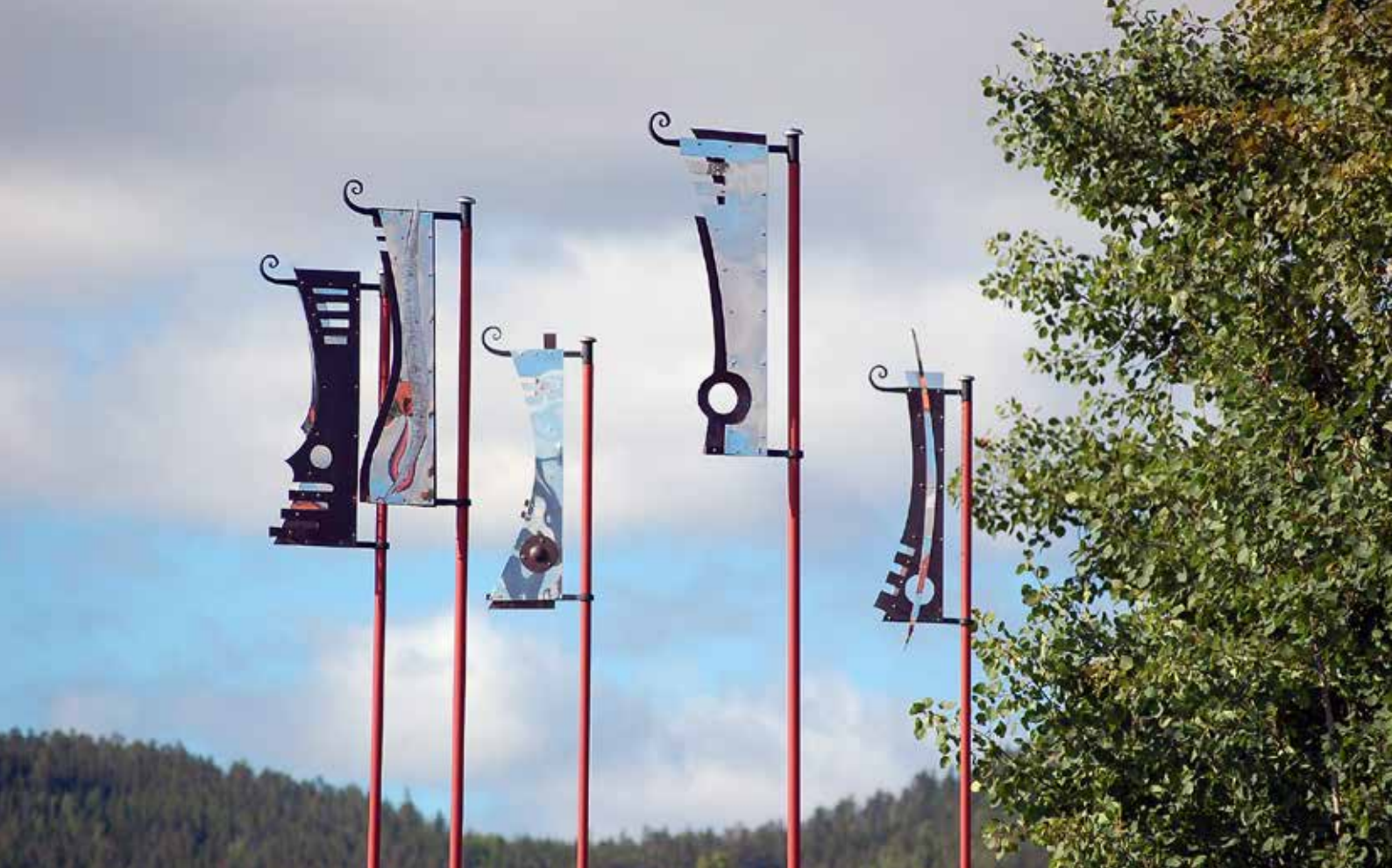
Konstverk av Fredrik Thelin.

Agenda 2030 utgår från att vår tids stora utmaningar är sammanlänkade och måste lösas genom samarbete och partnerskap, då målen är odelbara och integrerade. Det krävs samverkan för att målen ska kunna uppnås och kulturen kan ha en sammanlänkande kraft och tillåta människor att mötas oavsett kön, etnisk tillhörighet eller ålder. Arbetssättet med både den regionala och lokala kulturplanen går i linje med mål 17 om vikten av samarbete över gränser för att skapa en hållbar utveckling. Samverkan främjar ett innovativt klimat- och miljöarbete som i sin tur kan bidra till att driva en hållbar utveckling. Den lokala Kulturplanen tar avstamp i ”Regional kulturplan Gävleborg 2019–2021”, vilken verkar både direkt och indirekt för att nå de globala målen framför allt genom utvecklingsområdena ”Öppenhet och demokrati” samt ”Hållbar attraktivitet”.