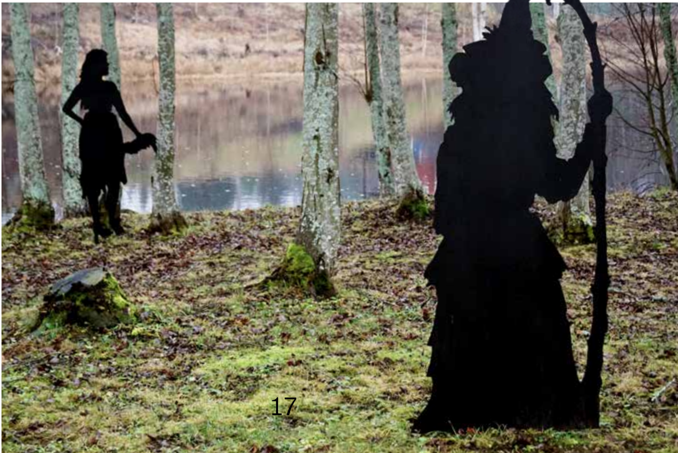
Konstverk av Anja Tellin.

Nordanstigs konstförening arrangerar i samarbete med Lions en konstrunda i maj varje år då det finns möjlighet att besöka flera av våra lokala konstnärers ateljéer.