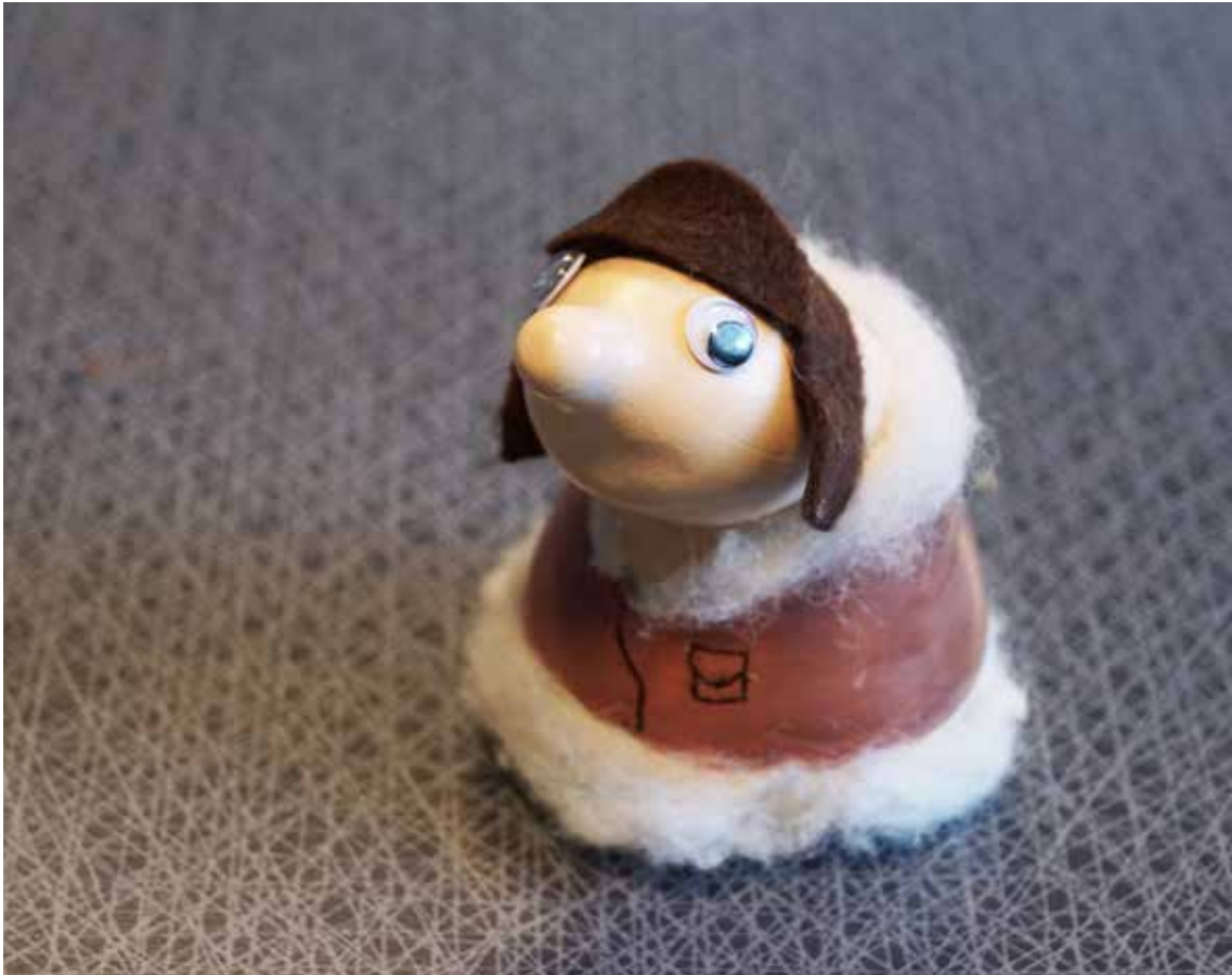
Figuren är en "Gurgla" och skapas i bildundervisningen av 9:orna på Bergsjö skola.