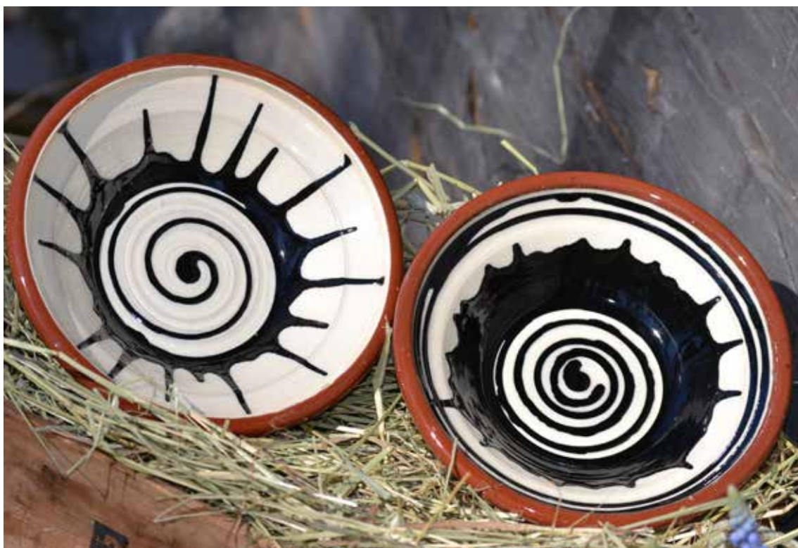
Keramikfat från Blomkruksfabriken i Gränsfors.

”Kulturen i alla dess former är en arena där var och en kan få kreativ stimulans både som utövare och konsument.”