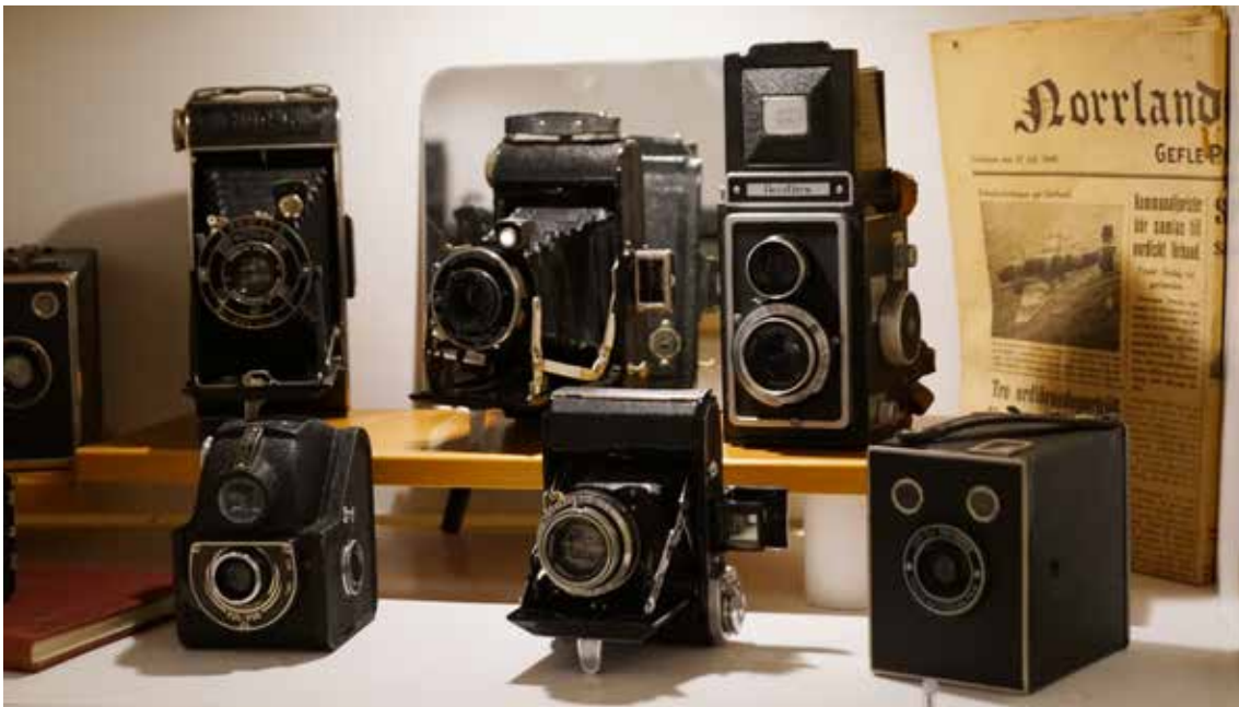
Kameramuseum i Strömsbruk.

Förutom våra hembygdsgårdar finns i kommunen ett antal specifika museer som drivs ideellt. Radiomuseet i Hassela, Brandstationsmuseet i Gnarp, Ingaskärs lotsmuseum i Stocka, Kustmuseet i Mellanfjärden, Yxmuseet i Gränsfors och Kameramuseet i Strömsbruk. Våra museer fyller en viktig funktion för folkbildningen.