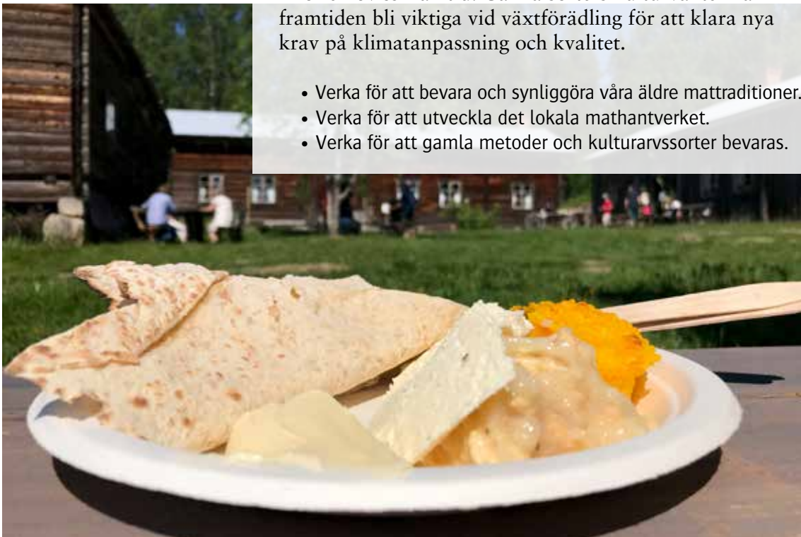
Ersk-Matsgården i Hassela.