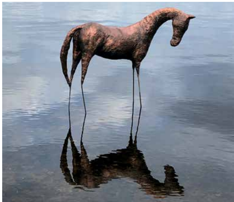
Skulptur av Helena Henning Bernmyr.

Att ta hänsyn till barns intressen, att låta barnets intresse väga tungt gentemot andra intressenters samt att låta barnen komma till tals är bra utgångspunkter om man vill säkerställa att man följer barnrättslagen.