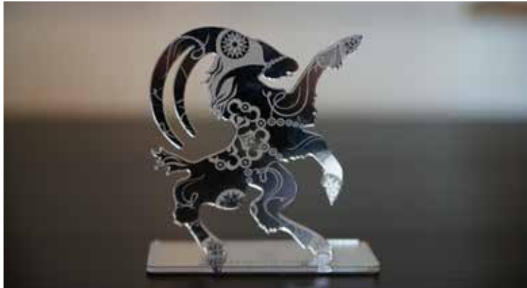
Hälsingebocken gestaltad av Caroline Tinterova.