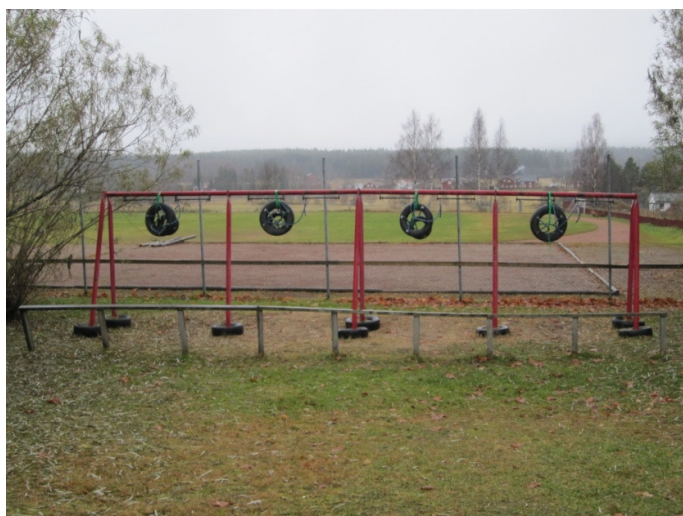
Gungor bör bytas ut, fallskydd kompletteras, inspringningsskyddet repareras/byts