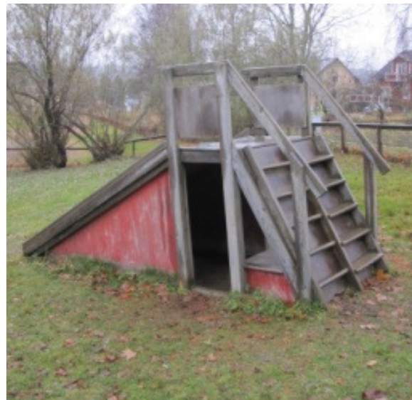
Koja rustas eller byts ut