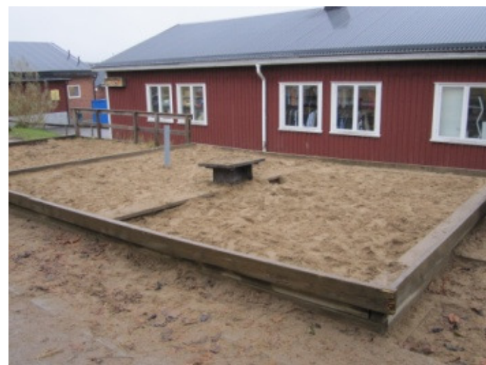
Mer sand i sandlådan