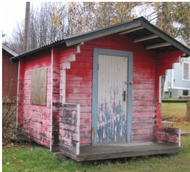
Ny färg på förrådet