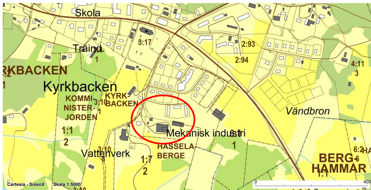
Planområdets läge i samhället.