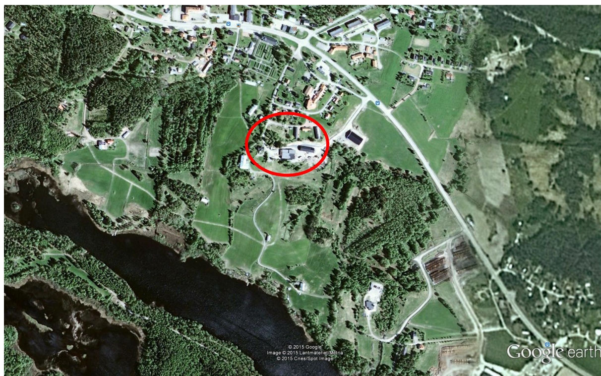
Översiktsbild över planområdet och omkringliggande bebyggelse.