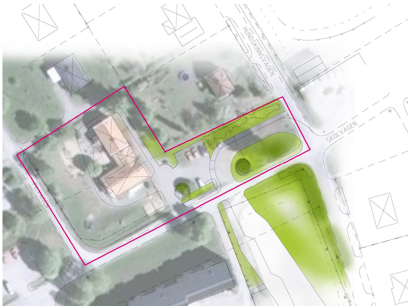
Illustration över planområdet med infartsgata för skolbussarna.