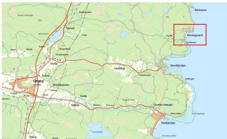
Planområdets läge markerat på karta