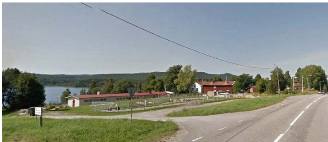
Hassela friluftsbads långsmala ljusa huvudbyggnad med hembygdsgårdens byggnader i bakgrunden.

För nytillkommande bebyggelse i planområdets södra del, tillåts en största tillåten totalhöjd av +135,0 meter över nollplanet. I planområdets norra del tillåts en högsta nockhöjd av 3,5 meter.