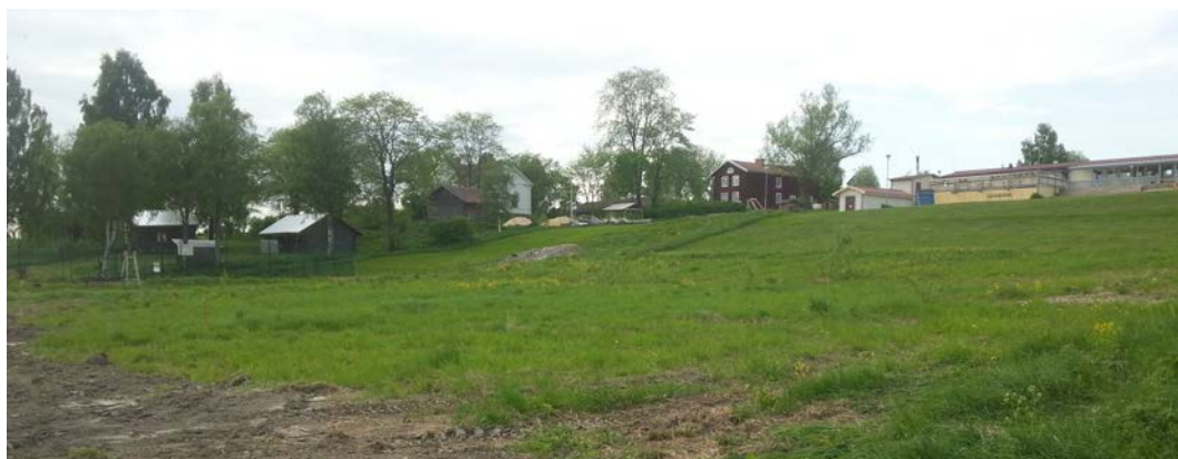
Hassela friluftsbad sett från sjösidan.

Varsamhetsbestämmelsen (k) innebär regler som säger att om man ändrar en byggnad eller en miljö så ska det ske varsamt så att vissa utpekade karaktärsdrag bevaras. Vid ändring och underhåll av befintlig huvudbyggnad för Hasselabadet ska dess ursprungskaraktär bevaras. Särskilt byggnadens låga och långsmala volym, med lågsluttande tak ska beaktas.