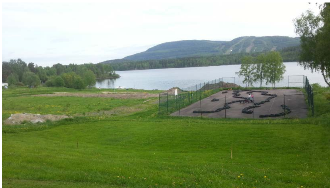
Utsikt ner mot sjön över den gamla tennisbanan som idag är en racingyta för trambilar.

mot vatten gör också att det är ett möjligt boplatssläge ända från stenålder och framåt. Ungefär tvåhundra meter väster om planområdet finns dessutom ett gravfält. Allt detta sammantaget innebär att behov av en arkeologisk utredning kan finnas inom området. Länsstyrelsen ska därför kontaktas inför uppförande av nya byggnader inom det aktuella området.