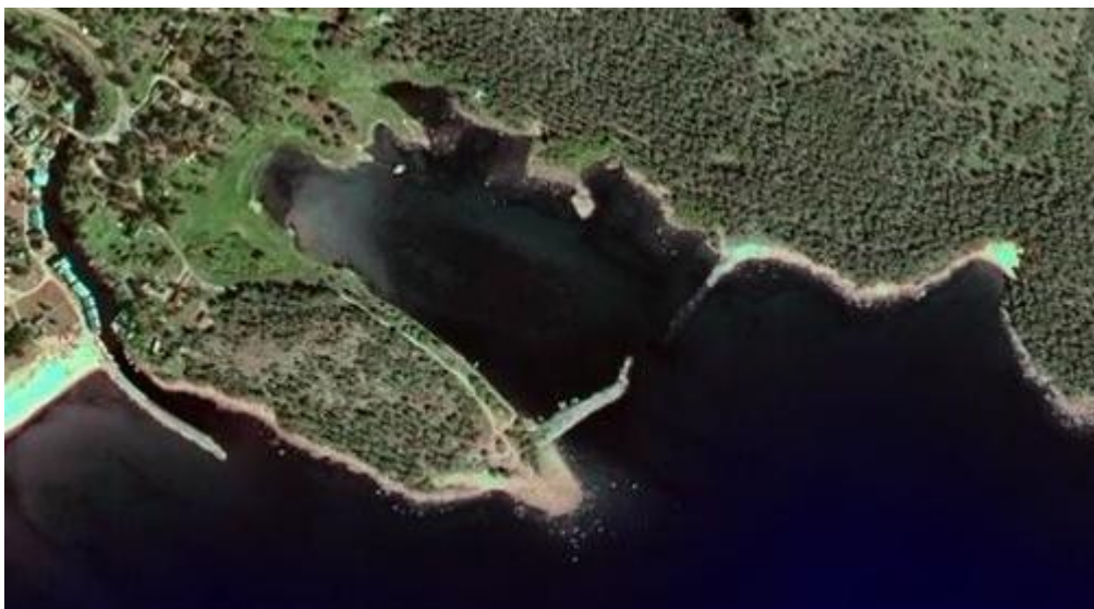
Figur 2 – Klasudden och Klasviken. Vågbrytarna ligger som skydd ut mot öppet vatten.

Idag är området sydväst om Klasudden exploaterat, medan det inte finns någon nämnvärd exploatering ute på udden. Planarbete pågår dock för en exploatering både på södra och norra delen av klasudden. Exploatering planeras för såväl bostäder, en restaurang som för en småbåtshamn inne i viken och eventuellt även en tankstation för båtar.